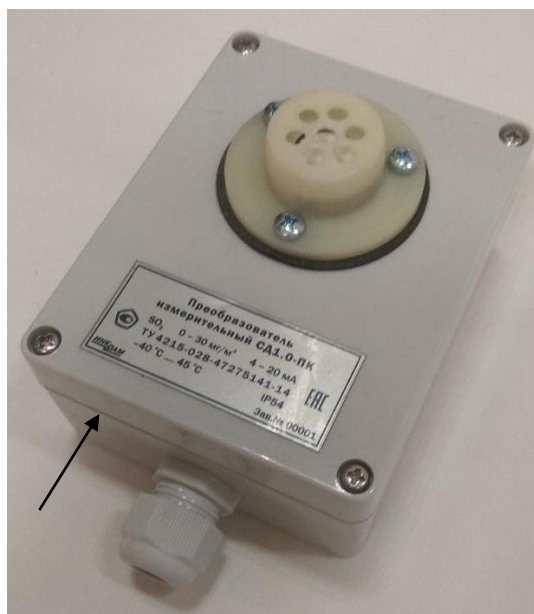
б) ИП в корпусах ПК, МК, ВУ, ЭМС