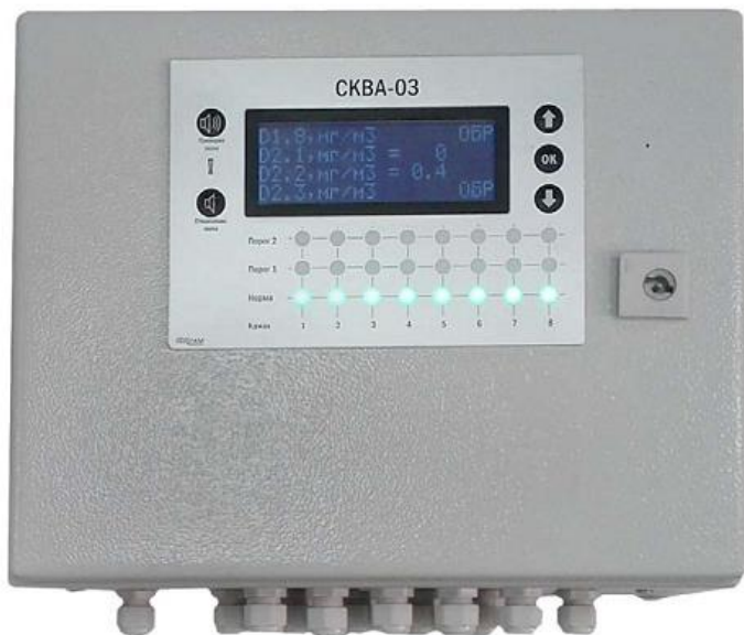
а) блок сигнализации и управления