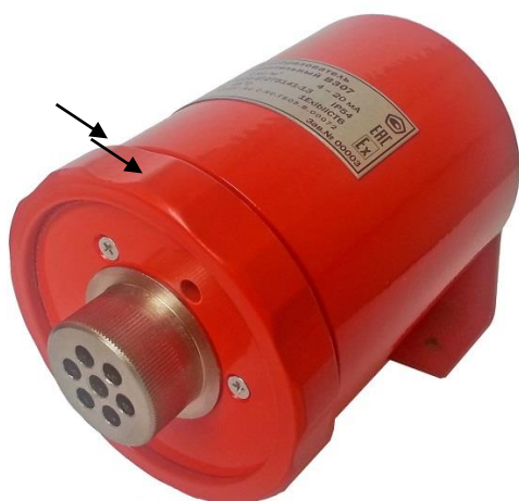
г) ИП серии В300, С300