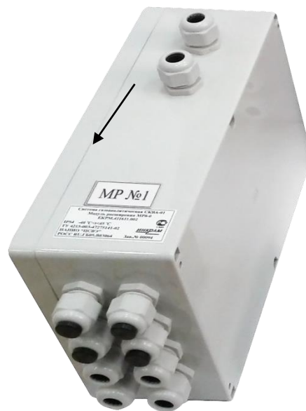
б) модуль расширения