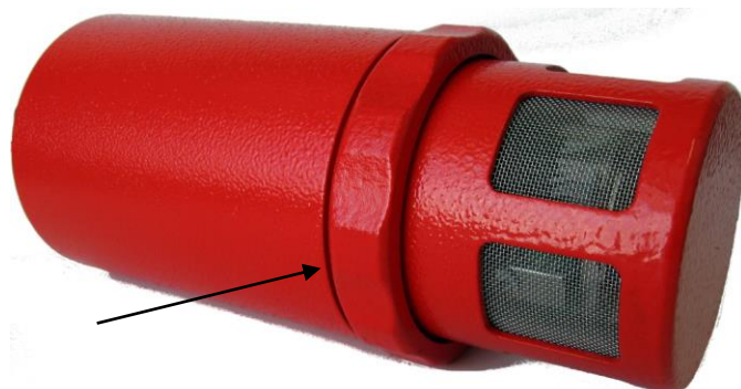
д) ИП АРП 1.0