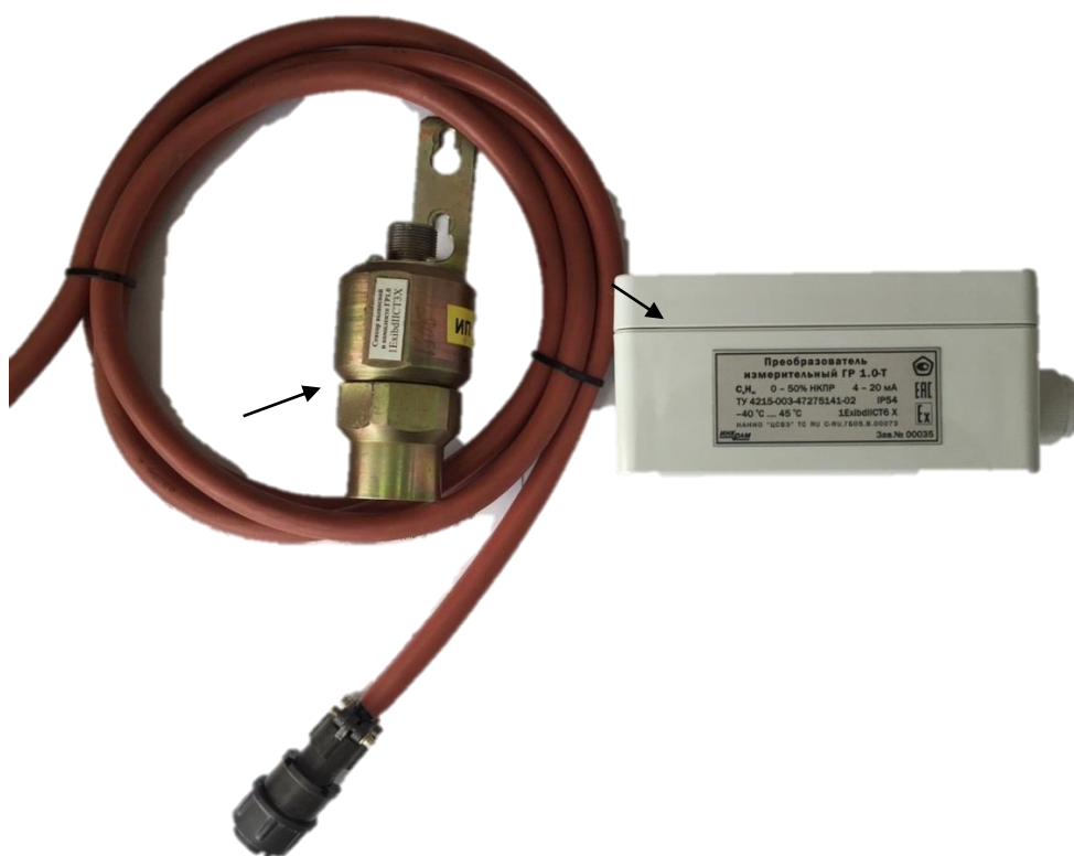
в) ИП серии ГР1.0 с выносным сенсором